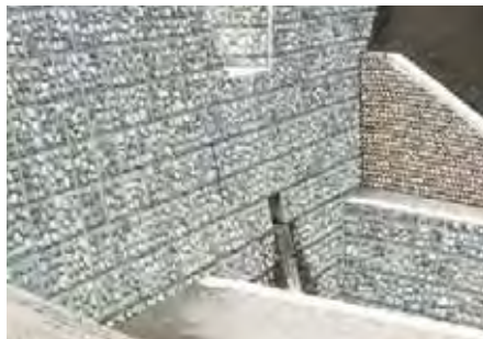
国交省 越美山系砂防工事事務所 白川第二砂防堰堤