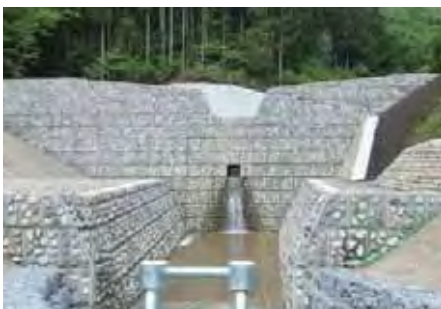
国交省 越美山系砂防工事事務所 白川第二砂防堰堤