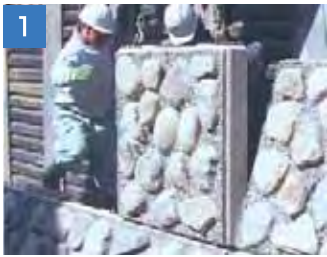
1 クレーンで製品を据付けます。