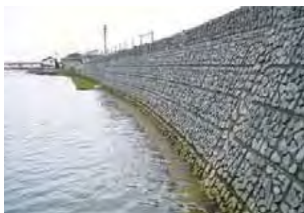
国交省 大洲河川国道事務所 肱川長浜堤防