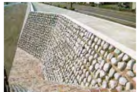
鹿児島県 北薩地域振興局 米ノ津川