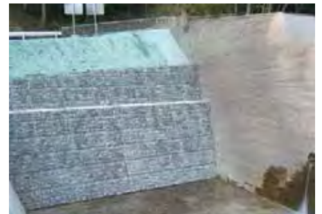
国交省 四国山地砂防事務所 宮の谷堰堤