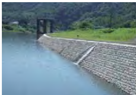
群馬県 渋川土木事務所 吾妻川