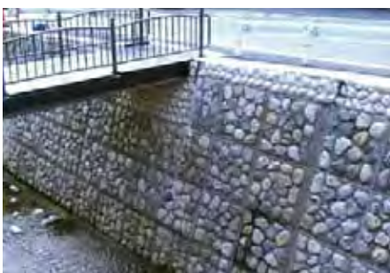
京都府 京都市役所 鞍馬川