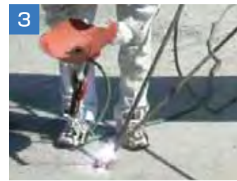
3 鉄筋下部を挿し筋に溶接して固定し、コンクリートを打設します。