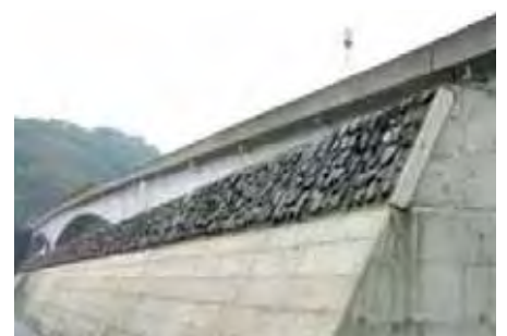
神奈川県 真鶴町役場 岩漁港防波堤