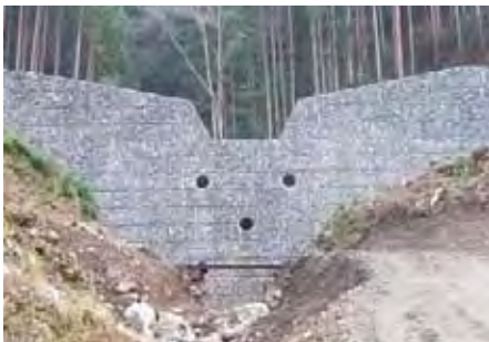
高知県 須崎土木事務所 虎杖川