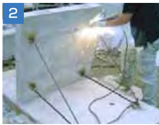
2 背面の長ボルトに鉄筋を溶接します。