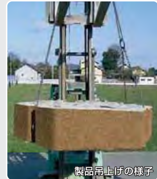
製品吊上げの様子